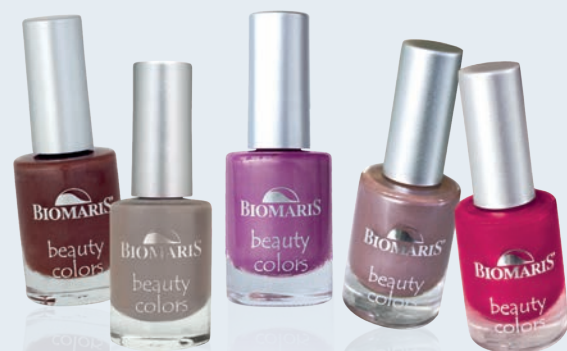
Abb. von links nach rechts: dunkelrot-metallic, cappuccino, flieder-pearl, rosenholz-pearl, red passion